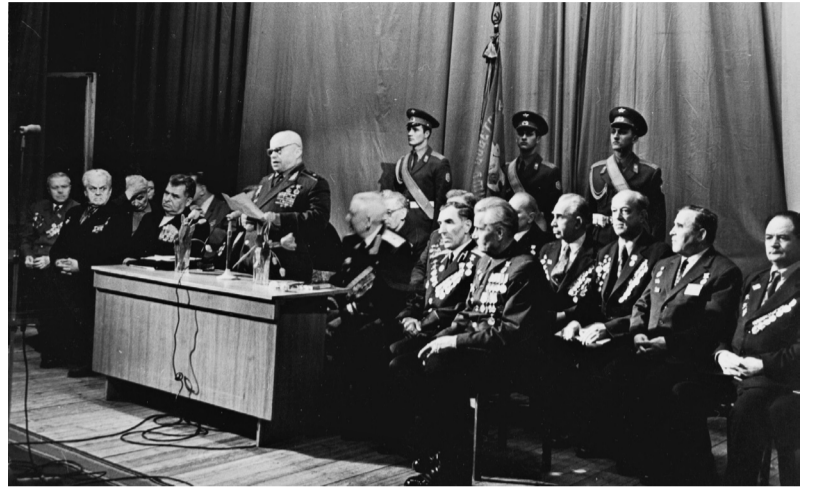
Встреча гвардейцев в Москве, 1977 год.