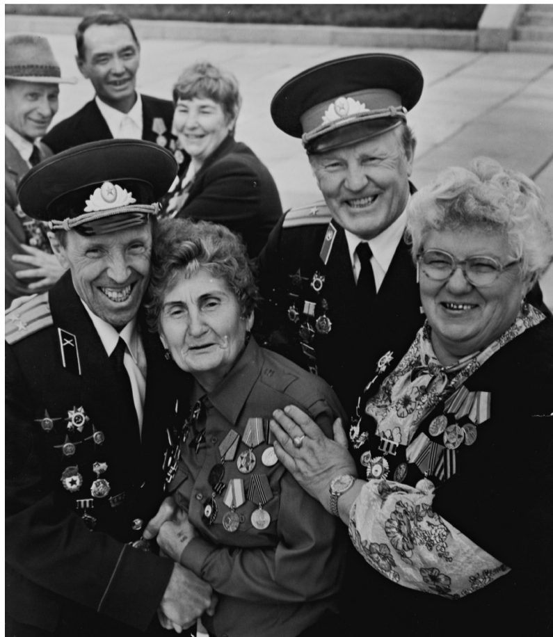
Встреча гвардейцев в Томске, на родине формирования дивизии. 1981 год