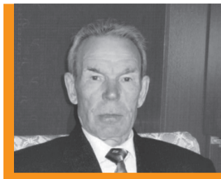
Будучи в том горестном времени, мы, малолетки, враз простились с безмятежным детством. То роковое утро 1941-го...