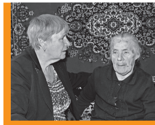
Надежда и оплот родной земли, Не подведут людей и не обманут, Как их мужья страну не подвели..