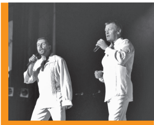
Томских десантников поздравляет вокальная группа «СССР» из Белоруссии