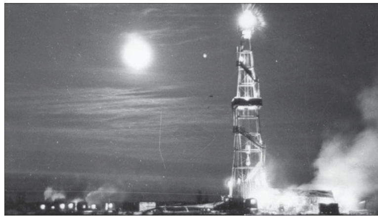
■ Буровая. Соснинская площадь. 18.08.1962 г.